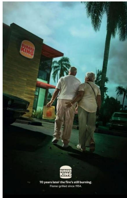
Figura 04 – Casal de idosos trocando caricias no estacionamento da lanchonete