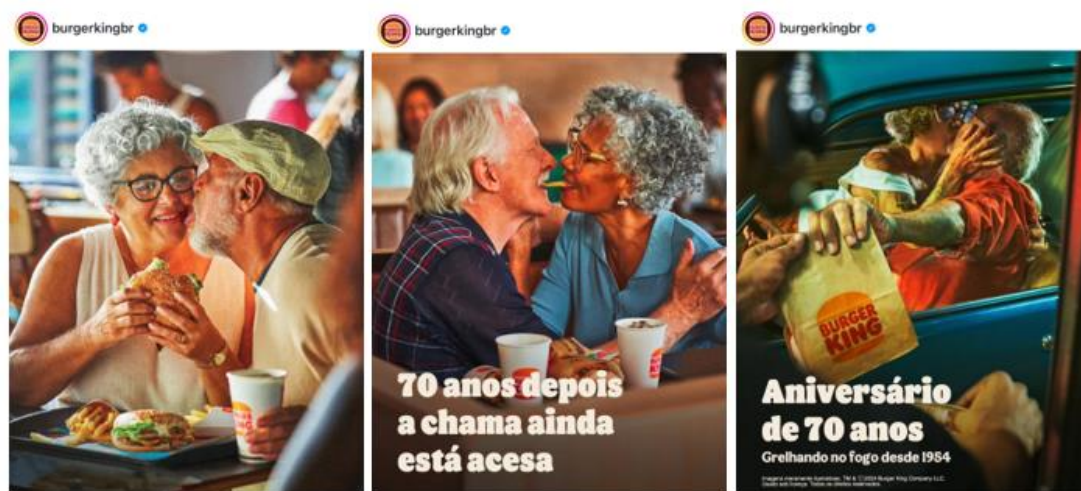
Figura 02 – Campanha veiculada no Instagram da marca com casais de idosos