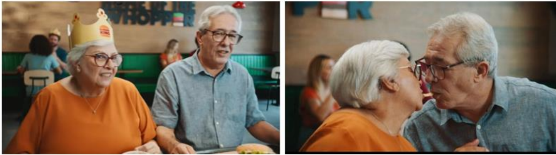
Figura 01 – Print do vídeo institucional da propaganda da marca com casal de idoso na lanchonete