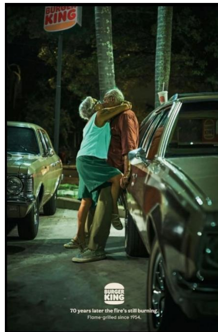
Figura 03 – Casal de idosos trocando afetos no estacionamento da lanchonete