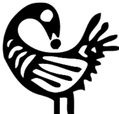
Figura 1: Representação gráfica de Sankofa

Fonte: Adinkra Symbols and Meanings (s.d.).