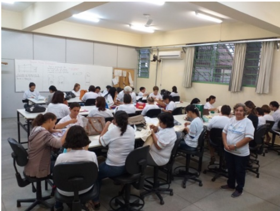
Figura 01 – Grupo de mulheres participantes da oficina