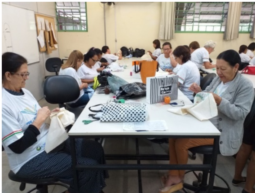
Figura 03 – Idosas participantes da oficina