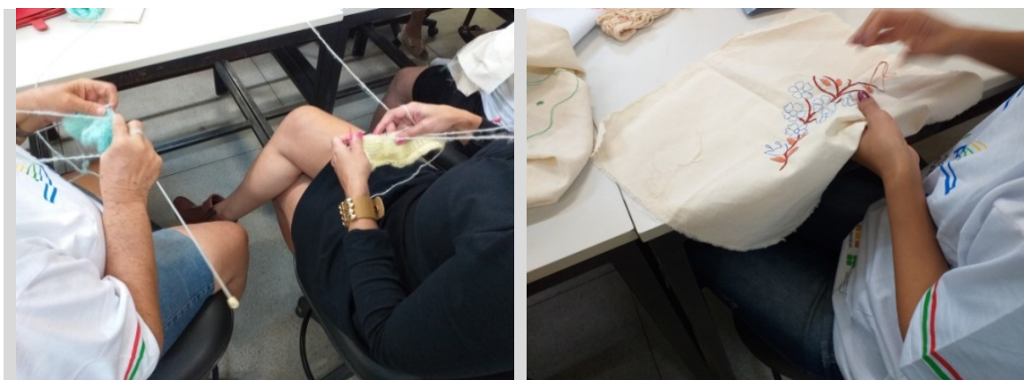
Figura 02 – Atividade desenvolvida de bordado manual e tricô