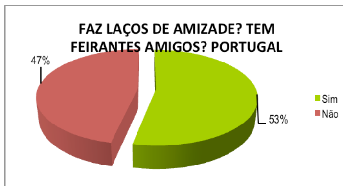
Gráfico 01 – Demonstrativo de laços de amizade entre fregueses e feirante (Portugal)