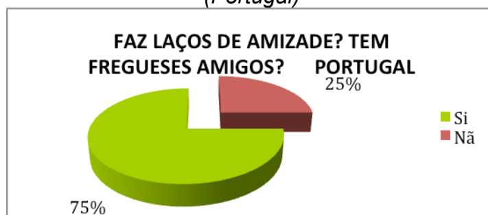
Gráfico 02 – Demonstrativo de laços de amizade entre feirantes e fregueses (Portugal)