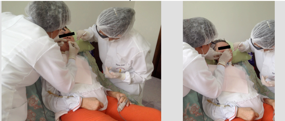
Figuras 4 e 5 - Realizou-se planejamento de atenção odontológica em domicílio – ADAPTAÇÃO PROFISSIONAL NAS CONDUTAS CLÍNICAS - Apenas as condutas essenciais foram realizadas.

higienização bucal foram dadas para as técnicas em enfermagem e familiares (MONTENEGRO e MARCHINI, 2013).