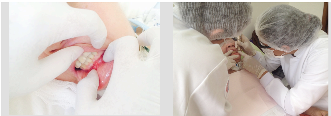
Figuras 2 e 3 – Paciente encontrava-se sob uso de próteses parciais removíveis superior e inferior, presença de saburra lingual e dificuldade de abertura bucal para uma correta avaliação clínica e higienização.

Observou-se clinicamente que a paciente era usuária de próteses parciais removíveis, superior e inferior, apresentava saburra lingual e dificuldade de abertura de boca, sendo essa última relatada como fator limitante na execução da higienização bucal da paciente pelas técnicas em enfermagem.