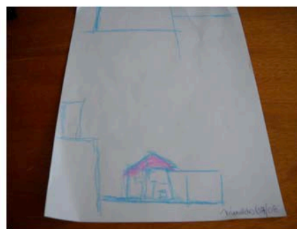
Figura 02 - MI