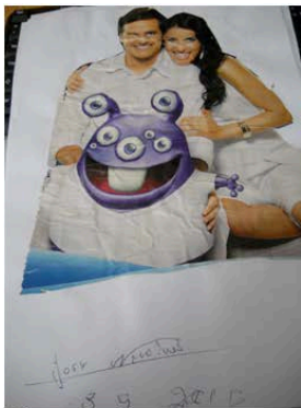
Figura 05 - NI

Focamos a atenção do idoso para seus reais desejos, no que acreditam, e despertar e valorizar o que há de belo em si e na vida, favorecer a confiança, a segurança e a curiosidade de poder fazer o que se gosta, como recortar e colagem (Figuras 05, 06, 07, 08).