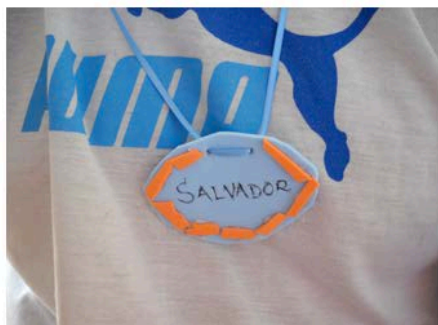
Figura 09 - SAL

dos crachás, que também favoreceu a confiança, a segurança, a curiosidade e a memória, surpreendendo o próprio idoso com resultado produzido (Figuras 09, 10, 11, 12).