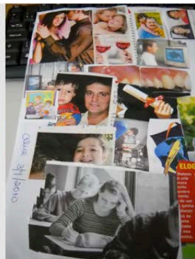
Figura 06 - AL