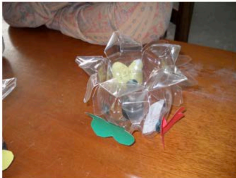
Figura 15 - SAL