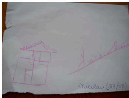
Figura 01 - NI

Observou-se que ficaram à vontade depois de um tempo em que estávamos lá. Suas reações, no começo, foram de timidez e de não expor o que sentiam, mas depois de algum tempo já desenharam com certa liberdade, sentindo-se mais à vontade com o papel e o lápis. Para finalizar, cada idoso nomeou seu desenho, para que não se perdessem (Figuras 01, 02, 03, 04).