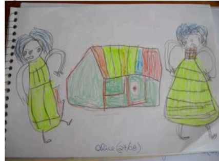
Figura 04 - AL