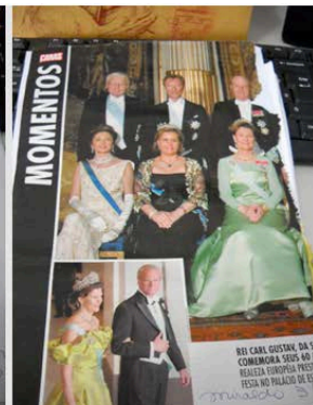
Figura 08 - MI