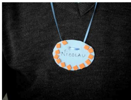
Figura 10 - NI