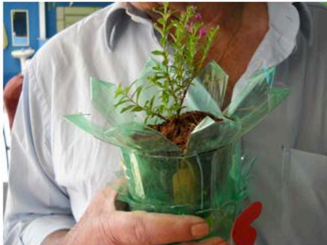
Figura 13 - MI

Este encontro propiciou a concentração e a memorização voltadas para a beleza e o acolhimento, mostrando ao grupo a capacidade de cada um para utilizar a coordenação e a imaginação. A linguagem plástica e artística expressos na beleza das plantas voltou ao encontro de si mesmo ao promover o relaxamento e a visualização criativa (Figuras 13, 14, 15, 16).