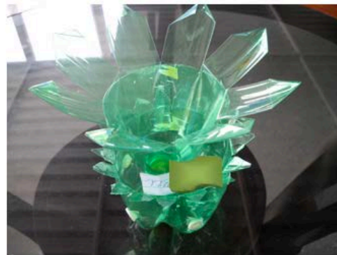
Figura 16 - NI