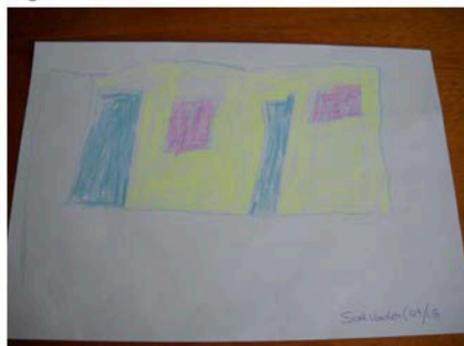
Figura 03 - SAL