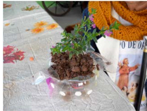
Figura 14 - AL